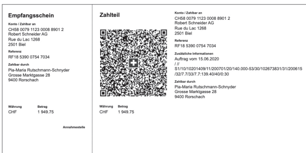
Variante 3: QR-Rechnung mit Creditor Reference und IBAN (neue Nutzungsmöglichkeit)

QR-Rechnungen können in ein paar einfachen Schritten am eigenen Computer erstellt und gedruckt werden. Da-