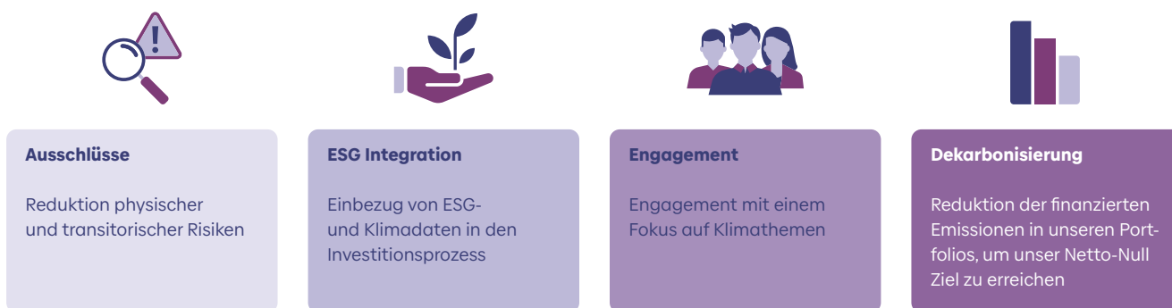
Abbildung 2: Die Klimastrategie von Baloise Asset Management basiert auf vier Säulen

Mehr Informationen über die Klimastrategie sind unter den folgenden Link abrufbar: https://www.baloise.com/de/home/ueber-uns/wofuer-wir-stehen/nachhaltigkeit.html